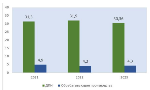
Рис. 1. Отраслевая структура ВДС, % (по данным Росстат)

В отраслевой структуре валовой добавленной стоимости (ВДС) 30% и более приходится на добычу полезных ископаемых (ДПИ), а на обрабатывающую промышленность всего 4,2-4,9 % (рис. 1). При этом