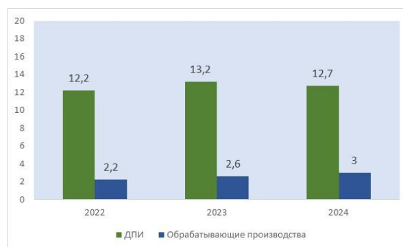
Рис. 4. Объем отгруженных товаров собственного производства по ДПИ, % (по данным Росстат)

Fig. 3. Share of unprofitable mining enterprises, % (according to the Federal State Statistics Service (Rosstat) data)